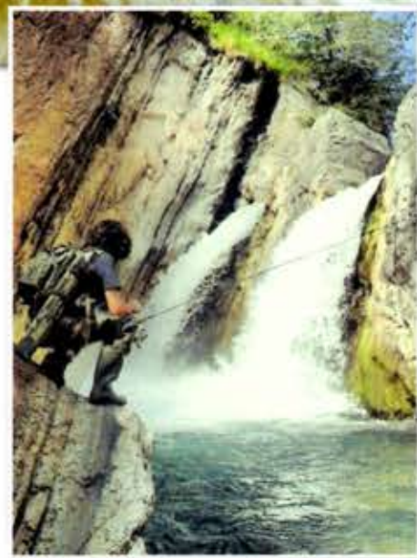
ALCUNE IMMAGINI DELL'AUTORE NELLA SUA TERRA DI ORIGINE!

di pescare con artificiali senza ardiglione così non causate danno al pesce. I miei viaggi di pesca preferiti sono quelli in cui mi sveglio al mattino presto e con il mio zaino e la mia canna mi immergo nella natura, nei posti più selvaggi, circondato da paesaggi incontaminati. La mia pesca è fatta di forti emozioni, di fatica, di adrenalina e di molte soddisfazioni. Un'uscita di pesca ti resta per sempre nel cuore: i pesci che saltano, le loro fughe, le vittorie, ma anche le sconfitte. Il forte interesse per la pesca mi ha portato a creare una pagina su facebook intitolata "Pescjadours Furlans" che in dialetto friulano significa "Pescatori Friulani". E' molto coinvolgente perché vengono